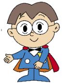
主税局イメージキャラクター タックス・タクちゃん

⚠ 申告期限（令和3年2月1日）を過ぎてしまった場合、軽減措置を受けることができなくなります。お早めにご申告いただきますようお願いいたします。