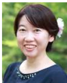
小野税務会計事務所 所長 税理士