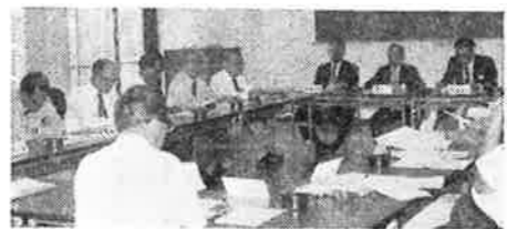
正副会長及委員長会