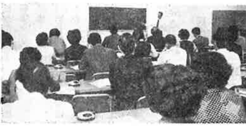
講義中の中垣講師と研修生

回を消化している。開講式には税務署長より、講習会の意義と激励のことばを戴き、研修生一同、研鑽への意欲を充分か