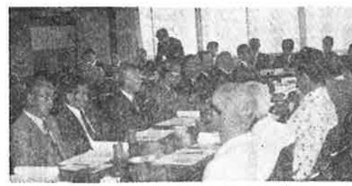
巢鴨地区正副支部長懇談会

七月に行われた正・副支部長会に引き続き、八月末より各地区毎に正・副支部長と署長、副署長等の大幹部との懇談会がなごやかに開催され、大成果をおさめて、九月末全部終了した。今回の開催の意義は調査型より指導型へと大きく転換を示しつつある税務当局の方針をふまえて、正しき記帳と適正申告への大目的実現の為に、実りのある事業の推進と模範的な組織の確立に向けて、色々と懇談がなされたことにある。特に署長、三名の副署長、其他の幹部の方々の熱意と誠意に対して、今後の当会役員活躍が期待される。