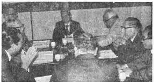
正副会長及委員長会

もし、仮に本税が10万円として納付が6か月遅れたとしますと不納付加算税が一率10%ですから1万円、延滞税が延滞日数に応じて3千6百円合わせて何と1万3千6百円もの付帯税がかかるのです。参考までに、銀行利息と比較してみてください。いかに不利かということがお分かりになると思います。 しかも、この1万3千6百円は、税法上会社の損金としては認められませんから、全く余計な負担といえます。