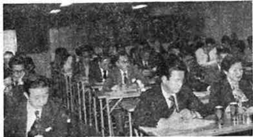
南池袋1-4丁目地区税務懇談会

一回にわたり実施された支部別懇談会は十一月二十二日の上池袋一〜四丁目の懇談会を最後に、全日程を終了した。本年度は特に昨年度の懇談会の内容を