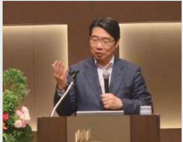
講演をする前川喜平氏