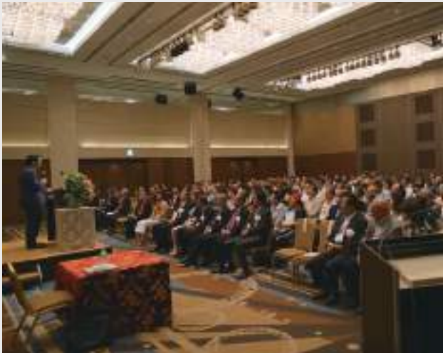
会場は満席で大盛況

最後になりましたが今回、後援いただきました豊島区、東京商工会議所豊島支部様、協賛いただきました豊島優申会、大同生命保険(株)、AIG 損害保険(株)、アフラック様に感謝申し上げます。