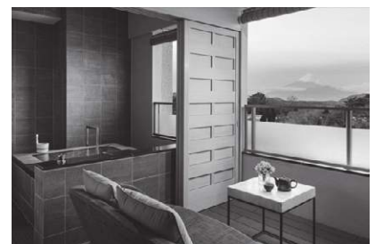
<ラフォーレ倶楽部>伊豆リゾートホテル修繕寺愛犬と泊まれるお部屋もございます