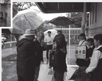
子供たちの激励に訪れた高野区長