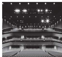
COVER PHOTO ハレザ池袋 豊島区立芸術文化劇場 東京建物 BrilliaHALL 内観

私達、広報委員会も皆様に楽しんでいただける広報誌をお届け出来るよう一丸となって頑張りますので、ラグビー同様応援よろしくお願いします。