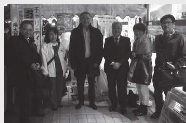
お手製のおでん、豚汁を提供